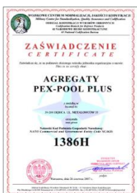
NCAGE NO. 1386H