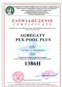
NCAGE NO. 1386H